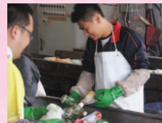
産業現場等における実習