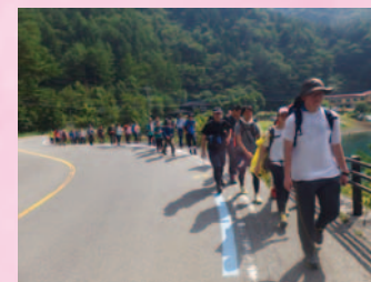
歩く合宿「目指せ!富士五湖踏破!」