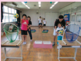
おはよう広場(体育)