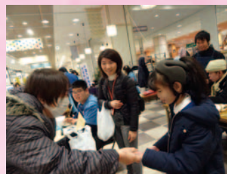
作業製品販売会「ふわふわゆきだるま冬市」