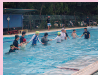
保健体育「プール学習」