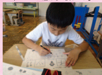
チャレンジタイム(自立活動)