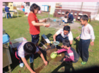
遊びの指導 「のびのび遊ぼう!秋ランド」