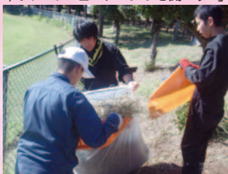
産業現場等における実習