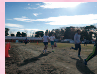
朝の運動(保健体育)