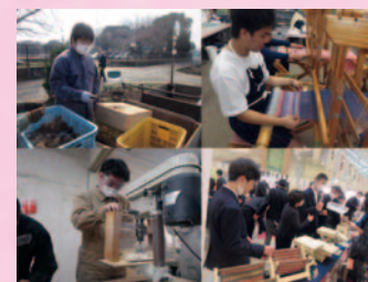
作業学習・販売会