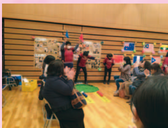
生活単元学習 「オリパラフェスタ2020を開こう!」