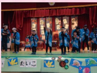
生活単元学習(音楽発表会) 「太鼓だ!パレードだ!お祭りだ!」